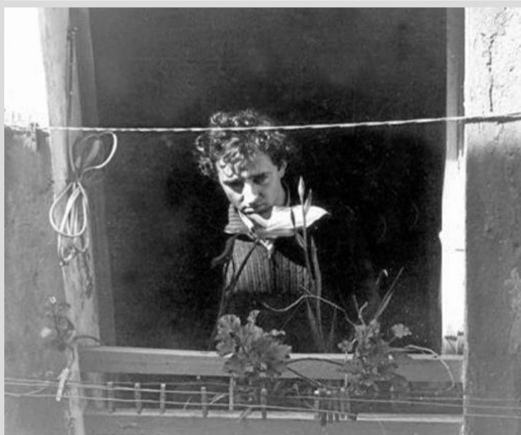
Roberto Bolaño se asoma a la ventana de su vivienda en la calle Talleres

Recién llegado de México, tras cerrar su episodio como abanderado del movimiento literario “Infrarrealismo” , Roberto Bolaño llegó a Barcelona en 1977, para instalarse en un pequeño piso de la calle Talleres 45, en pleno barrio del Raval, por donde el escritor chileno solía dar largos paseos a pie. Una vivienda humilde de apenas 20 metro cuadrados. Entre esas paredes germinaron los textos que lo llevaron a convertirse en uno de los escritores más reconocidos del panorama literario internacional.