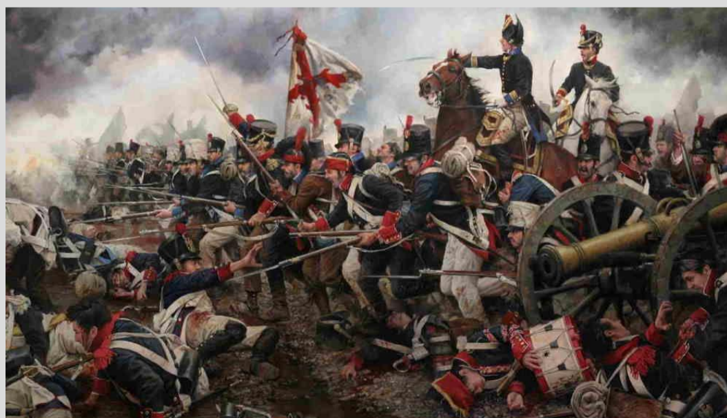
Lienzo de la Batalla de Ocaña, donde participó José Miguel Carrera, herido tras un brutal combate 1809

Fue el artífice del primer periódico del país "La Aurora de Chile" y de la "Biblioteca Nacional"