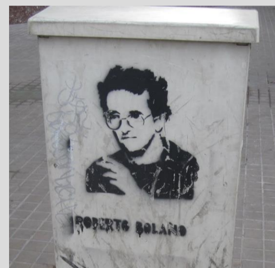
Foto reciente, de autor anónimo, donde una imagen de Bolaño se encuentra serigráfica, en un elemento del mobiliario urbano de Barcelona.