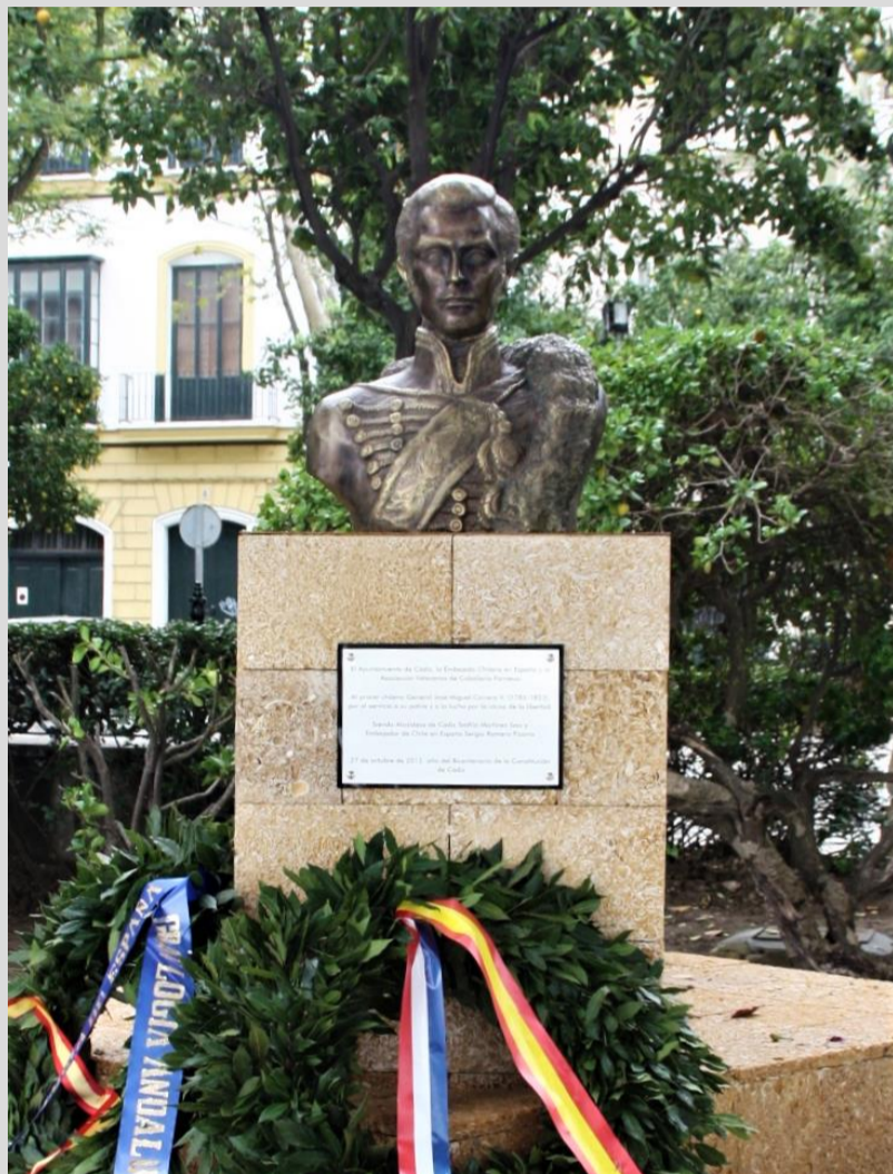
Busto homenaje a José Miguel Carrera, ubicado en el "Mirador de las Américas" ciudad de Cádiz

El intrépido y apasionado José Miguel Carrera, se forjó una brillante carrera militar en España basada en el heroísmo y don de mando