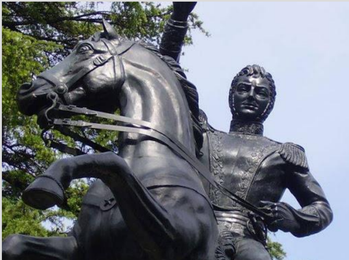
Fotografía con detalle del semblante de Bernardo O'Higgins

El Capitán General ocupa un lugar de honor en el centro de Madrid. La estatua preside majestuosa la entrada norte del Parque del Oeste.