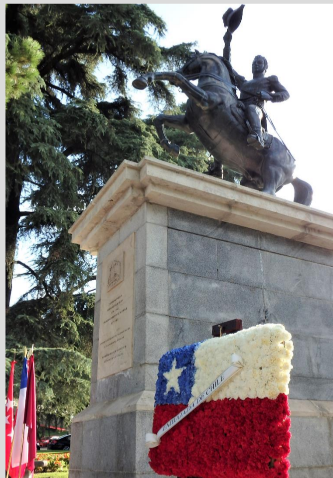
Ofrenda floral ofrecida por la Embajada de Chile cada 18 de septiembre, en conmemoración del Día Nacional de Chile