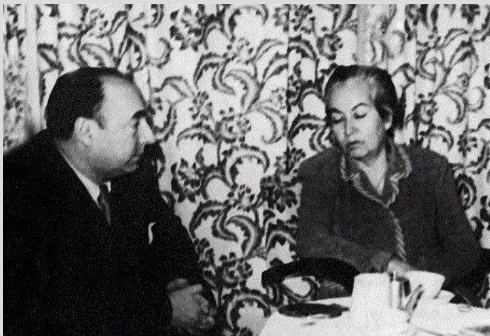
Pablo Neruda junto a Gabriela Mistral en Madrid

El destino reunió en la capital de España a dos premios Nobel de literatura, junto a la Generación del 27, un hecho único en la historia de la literatura