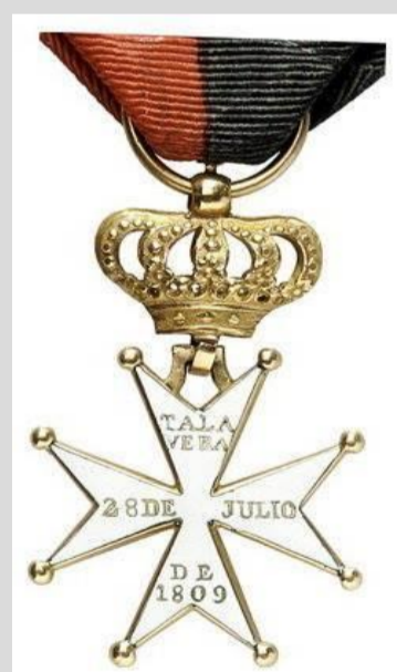
Foto de La Cruz de distinción de Talavera. Fue concedida a José Miguel Carrera, el 8 de diciembre del año de 1810 por el Rey Fernando VII, y en su real nombre el Consejo de Regencia de España e Indias, con motivo de la gloriosa batalla de Talavera de la Reina, ocurrida en 28 de julio de 1809.