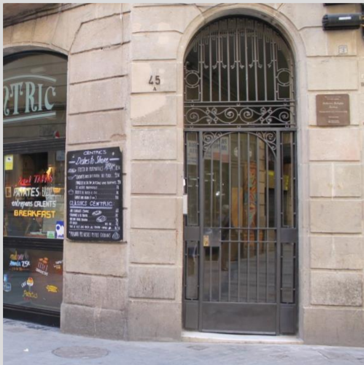
Foto actual de la fachada donde vivió el escritor Roberto Bolaño en Barcelona, en el número 45 de la Calle Talleres.

De su novela póstuma 2666, se dijo: “Desde 100 años de soledad, no se había escrito una novela en español que causara el brutal impacto de 2666”