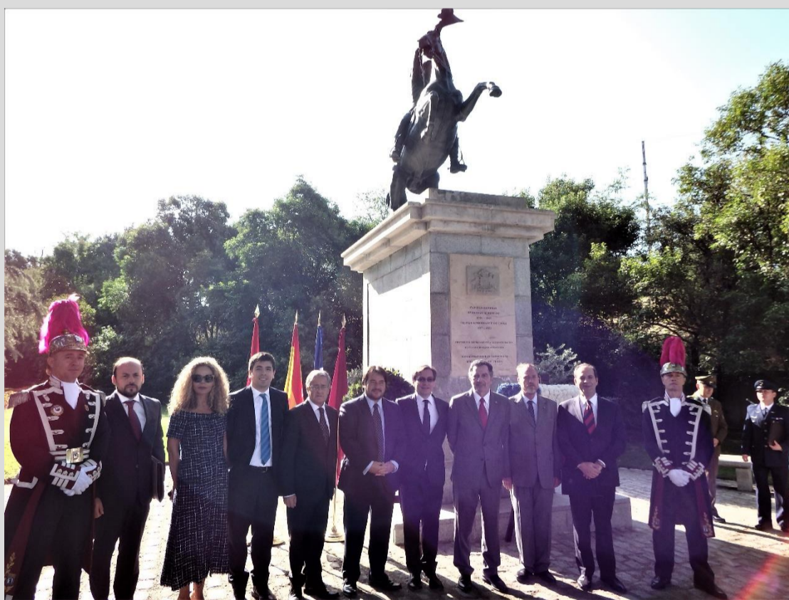
A los pies del monumento, funcionarios de la Embajada de Chile y del Consulado General, flanqueados por dos miembros de la Guardia Real Española

El Parque del Oeste es un lugar idílico donde poder pasear y descansar, rodeado de grandes árboles y frondoso pasto, pero también un lugar donde sentirse orgulloso de ser chileno.