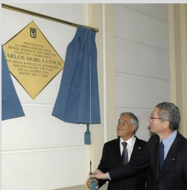
Inauguración de la placa conmemorativa otorgada por la ciudad de Madrid al ilustre diplomático, la cual puede verse en el edificio que antaño albergó la sede diplomática chilena. En la calle Prado 26. En la foto el Presidente Sebastián Piñera y Alberto Ruiz Gallardón, Alcalde de Madrid en 2011.

La apasionante gesta épica de este diplomático y escritor nacido en Santiago, se inicia cuando en octubre de 1928 es destinado como Ministro Consejero en la Embajada de Chile en España. Gran amigo de Federico García Lorca, compartió con los grandes escritores españoles de la época, conocida como la “Generación del 27”, donde también coincidió con Gabriela Mistral, Vicente Huidobro y Pablo Neruda.