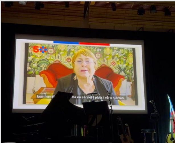
Mensaje de la ex Presidenta Michelle Bachelet.