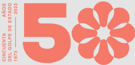
Mensaje de nuestro Presidente Gabriel Boric agradeciendo la solidaridad del pueblo sueco.